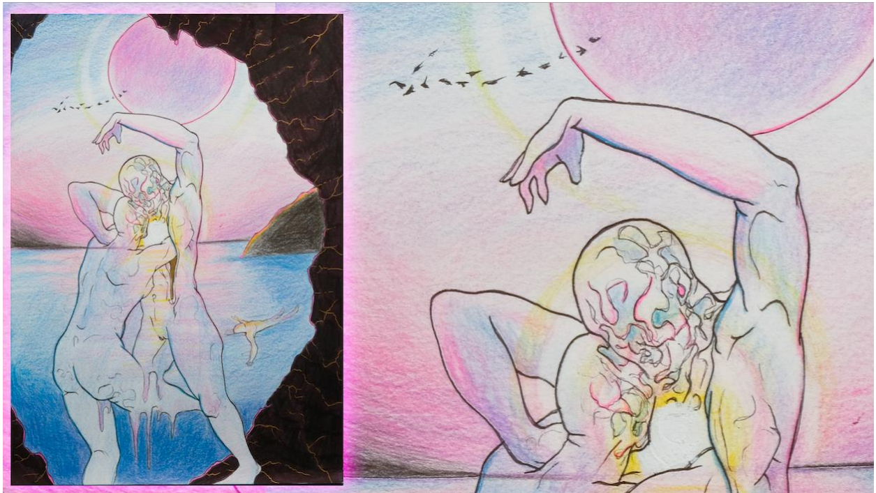
٢ معركة في الكهف