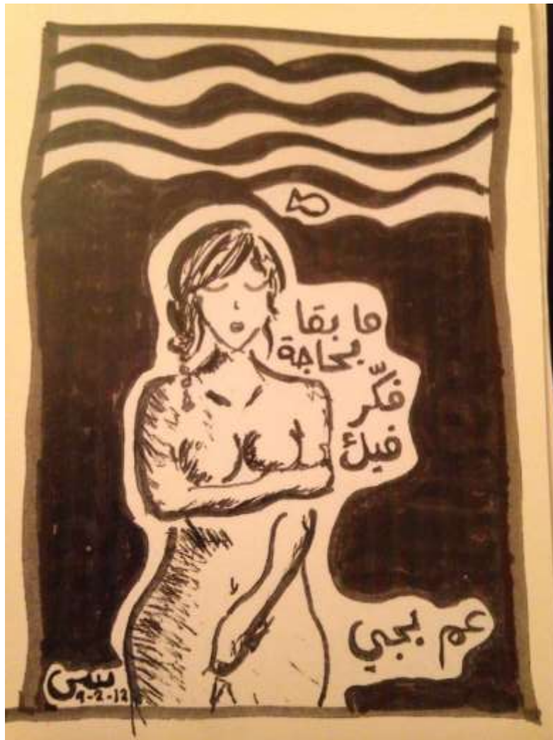
إحدى لوحات ساراغ

الملفت في هذه السلسلة برأيي هو خروج مواضيع لوحاتك عن التمثيل النمطي المقبول إجتماعياً للأجساد، كوجود الشعر على الأرجل في إحدى اللوحات مثلاً.