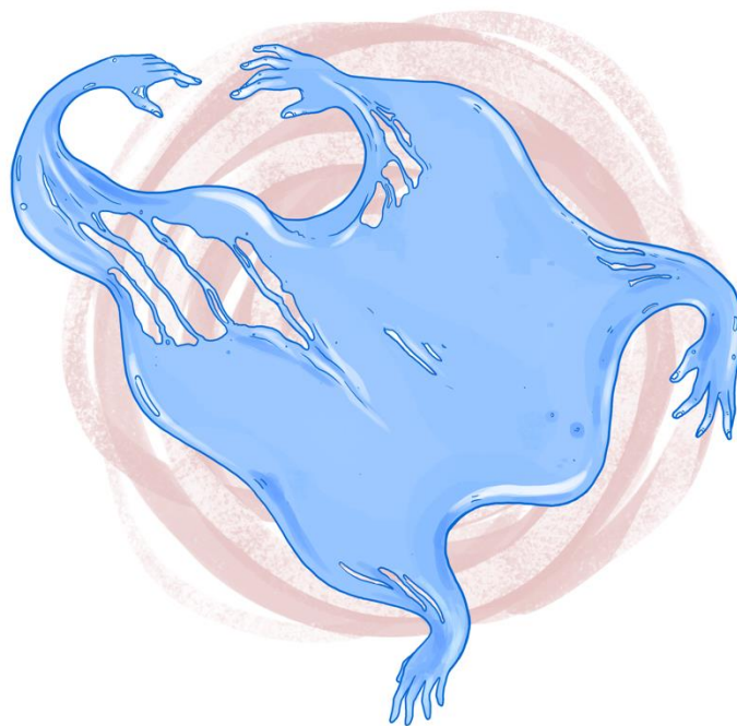
الصورة 1: تمزقات في النسيج

تُصوّر الرسوم جسمًا حيًا واحدًا يمثل جماعة أو منظمة، ونراه يتفاعل مع ذاته في كلّ منها بشكل مغاير، تخرج الأيدي كأغصان في جميع الاتجاهات، وتتحدث الأفواه أو تتشاجر، وتجتمع الأجزاء لتشكل شيئًا جديدًا أو تنصهر في صورة مغايرة تمامًا. تمثل الأقسام والتمزقات في نسيج الجسم التوترات ضمن الجماعة والتي تترسخ تحتها الأيديولوجيات المتعددة، التي قد تتصادم أو تتعلم من بعضها البعض، فتعيد تشكيل ذاتها وتنمو إلى شيء منطوّر، أو تنفصل من المجموعة لأنها لم تعد ترى نفسها في الكلّ.