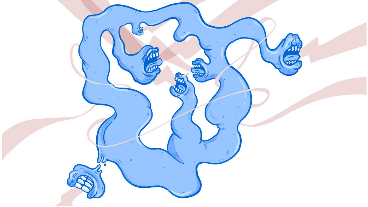
الصورة 2: تصادم داخلي