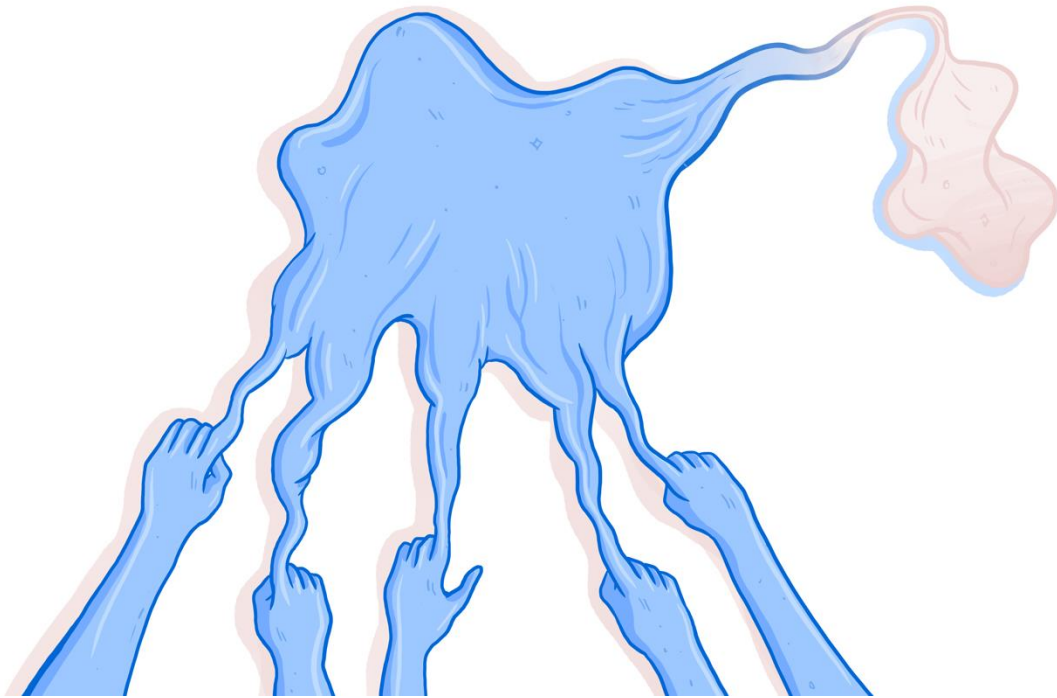
الصورة 3: الشرود